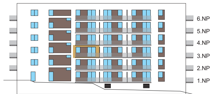
Východní pohled na dům/ Building View - East side